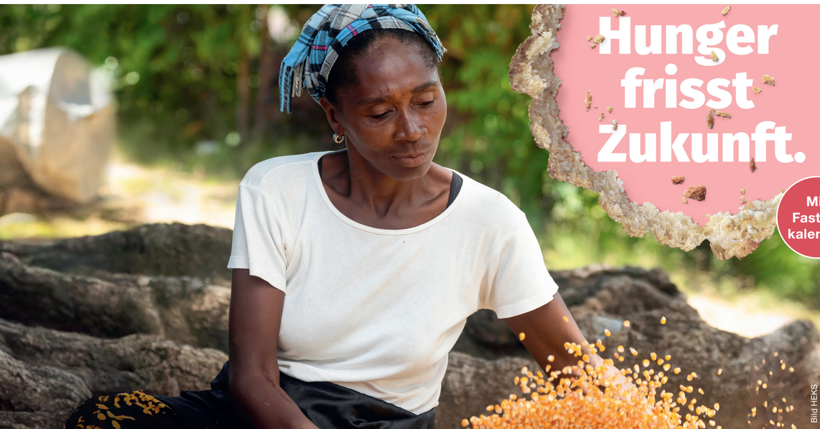
Die Kollekte des Suppensonntags geht an das Projekt «Schülergärten in Kenia». Wir danken für Ihre grosszügige Unterstützung.