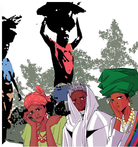
Freitag, 6. März, 19.15 Uhr kath. Kirche St. Martin